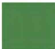
6771 VERDE CLARO ral 6018