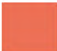
6769 NARANJA ral 2004