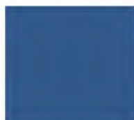
6750 AZUL CLARO ral 5005