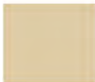
6755 MARFIL ral 1013