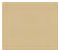
6754 CREMA ral 1014